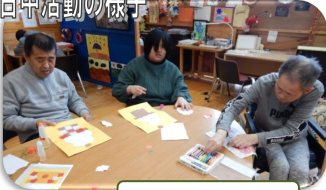
パズルに挑戦中です。