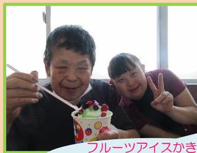
フルーツアイスかき氷♪ 冷たくて甘くておいしいね