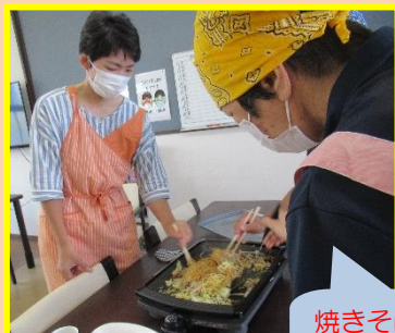
焼きそば作り… 真剣です！

7/19 (土) の休日開所日は外食に出かけました！ 昼食は居食亭さくまでラーメンやチャーハン、 冷やし中華などの様々なメニューから食べたいものを選んで注文しました。 食後はドライブを楽しみつつ、ヤスタヨーグルトへ行き、 冷たいアイスクリームやふわふわワッフルを味わいました。 おいしく楽しい開所日となりました。