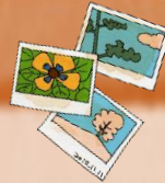
ふくしききてんはんばい 福祉機器展販売