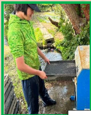
なえばこあらい 苗箱洗い