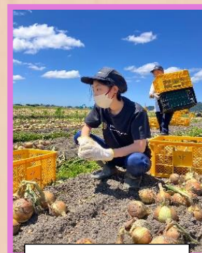
しゅうかく ようす 収穫の様子