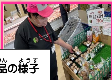
のうひん ようす 納品の様子